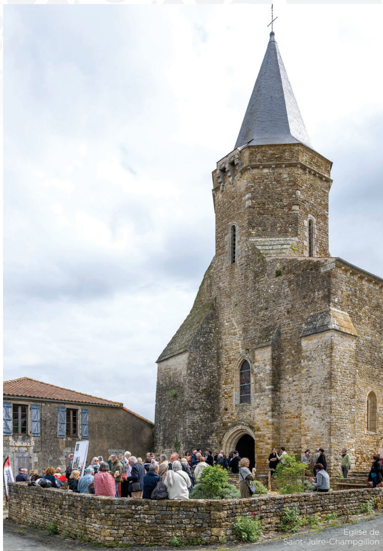
Église de Saint-Juire-Champgillon

Moments conviviaux par excellence, les Concerts & Café sont des rendez-vous emblématiques du Festival de Printemps. Le concept est simple : un artiste des Arts Florissants invite à découvrir une œuvre lors d'un court concert, avant de partager un café avec le public.